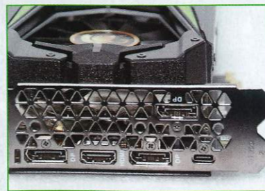
● 標準的3×DP、HDMI及USB Type-C輸出。