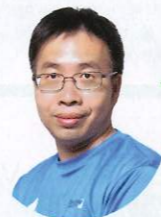
小洛夫 (PCM) 高級編輯

● 處理器：Intel Core i7-8700K (6C/12T 3.7GHz Base/4.7GHz Turbo) ● AIO水冷：Corsair H115i Pro RGB 280mm ● 主機板：MSI Z370 Gaming Pro Carbon AC ● 記憶體：2×Corsair CMK16GX4M1A2666 C16@XMP ● 儲存裝置：WD Black SN750 NVMe SSD 1TB ● 火牛：Antec HCP-850 Platinum ● 作業系統：Microsoft Windows 10 Pro x64 1903 ● 驅動程式：NVIDIA 430.86 gameready