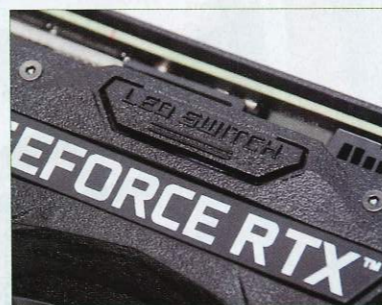
● 頂部的「LED Switch」主要作裝飾之用。

有謂NVIDIA公版是最穩定的版本，用料最有保證，此卡所用PCB及用料，以至1,635MHz GPU Boost Clock均與NVIDIA創始公版無異。而在DIY用家最關心的散熱方案，改用三風扇+高性能Composite Heatpipes。Composite Heatpipes特點是提供較傳統Heatpipes高的散熱效能，此卡共採用了5條Composite Copper Heatpipes (4×8mm+6mm)，使顯示卡工作溫度在31~55°C左右。對於不滿足1,635MHz GPU Boost Clock的用家，可使用TurboEngine程式的Quick Boost功能，把時脈進一步提升至1,665MHz，甚至自行嘗試更高的時脈。